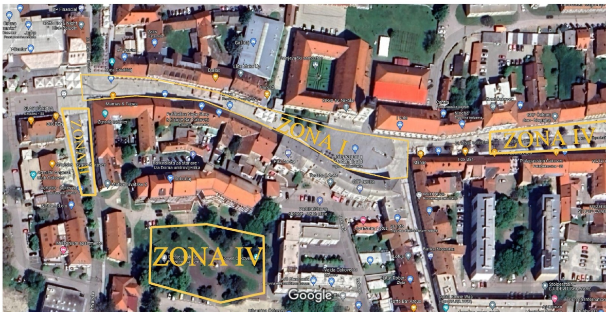
ZONA I - Ulica kralja Tomislava (od "vure" do Franjevačkog trga), Franjevački trg ZONA II - Ulica Matice hrvatske ZONA III - Park Valenta Morandimija, Ulica kralja Tomislava (kod zgrade Grada Čakovca)